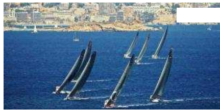
Teilnehmer der Copa del Rey in der Bucht von Palma im vergangenen Jahr